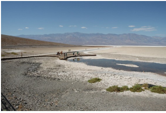
Bert de Wit, Death Valley USA

24/10 - Fotowedstrijd "Portret" of "Deel menselijk lijf"