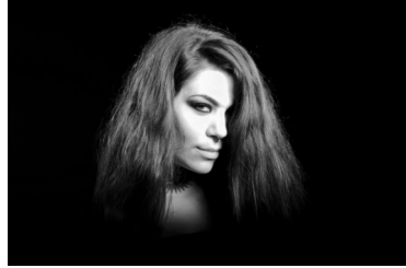
Peter Postmus – Modelfotografie